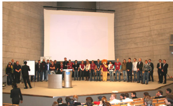
Das Team von Academy Consult zum Abschluss des Treffens auf der Bühne

Vor nunmehr etwa eineinhalb Jahren, am 29. Juni 2006, erhielten wir die freudige Nachricht, dass die Bewerbung von Academy Consult zur Ausrichtung des BDSU-Kongresses im November 2007 erfolgreich war. Gleichzeitig markierte dieses Datum den Beginn eines beispiellosen Organisationsaufwandes, der schließlich in den Wochen und Tagen vor dem Treffen für das Organisationsteam in hektischer Betriebsamkeit mündete. Spätestens ab dem Beginn des Kongresses am Donnerstag, dem 22. November, war es dann soweit – jedes einzelne aktive Mitglied unseres Vereins war gefordert, um den Teilnehmern und Unternehmensvertretern einige unvergessliche Tage zu bereiten.