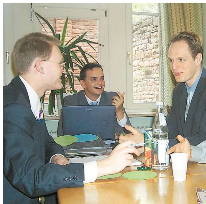
Üben für die Praxis: Mitglieder der studentischen Unternehmensberatung „Junior Comtec“ im Darmstadt proben eine Präsentation.

Marktstudien für die Lufthansa, Mitarbeiterschulungen bei der Deutschen Telekom, Prozessanalysen für Start-Up-Unternehmen: Je nach Universität unterscheiden sich die Schwerpunkte. Bei Junior Comtec geben die Wirtschaftsingenieure den Ton an, aber im Team arbeiten auch angehende Mathematiker und Psychologen. „Wichtiger als der Studiengang sind uns Ar-